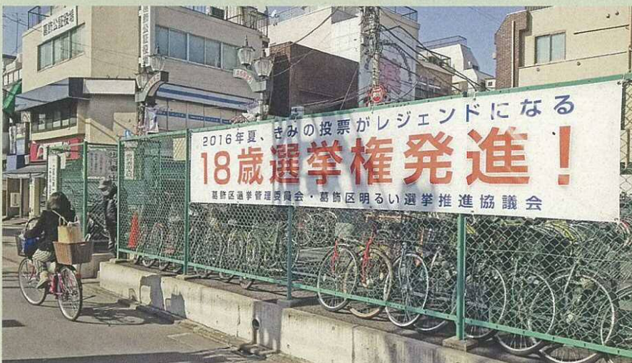
【京成石駅駐輪場前】