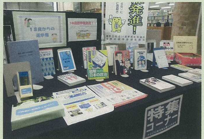
【水元図書館啓発写真】