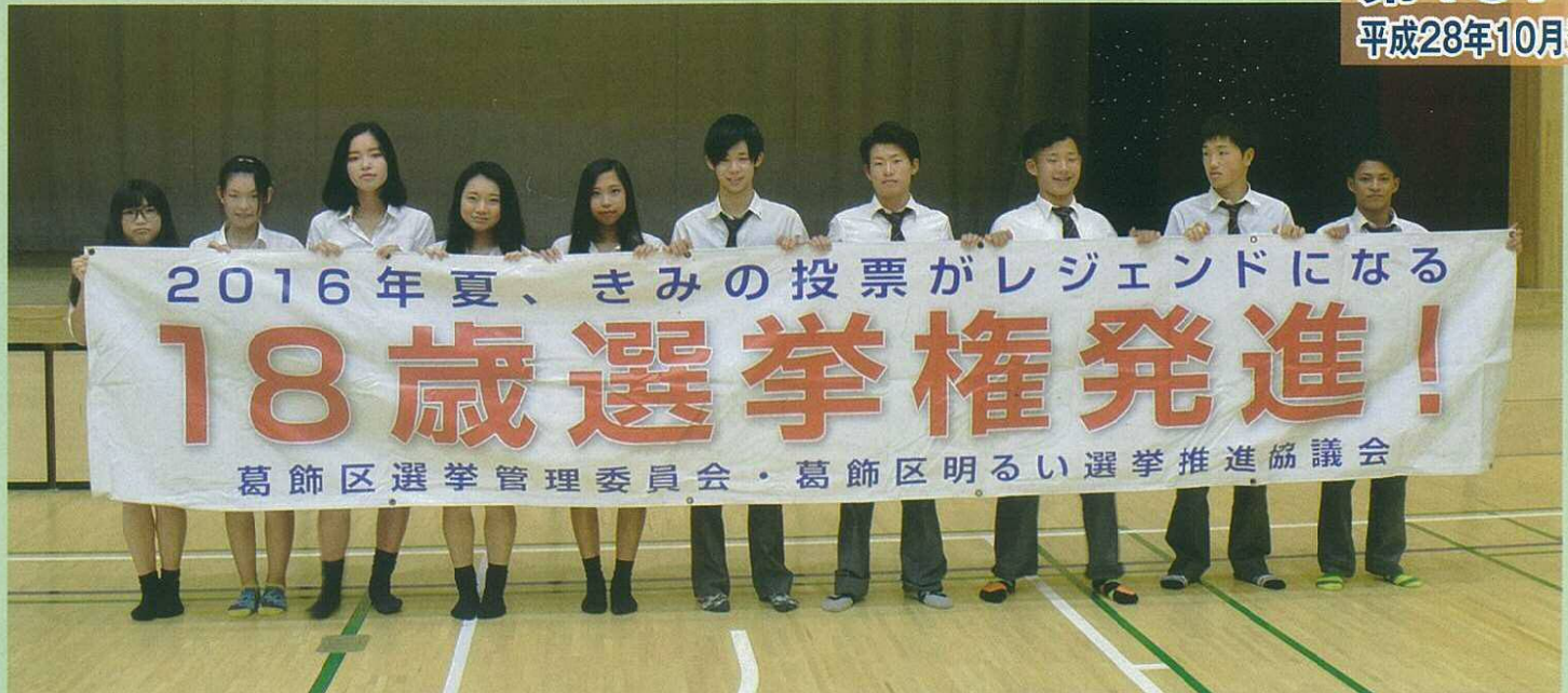
【18歳選挙権発進！横断幕を手持つ南葛飾高等学校3年生の皆さん】