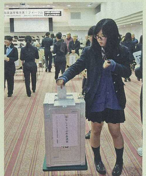
【18歳選挙権フォーラムの様子】