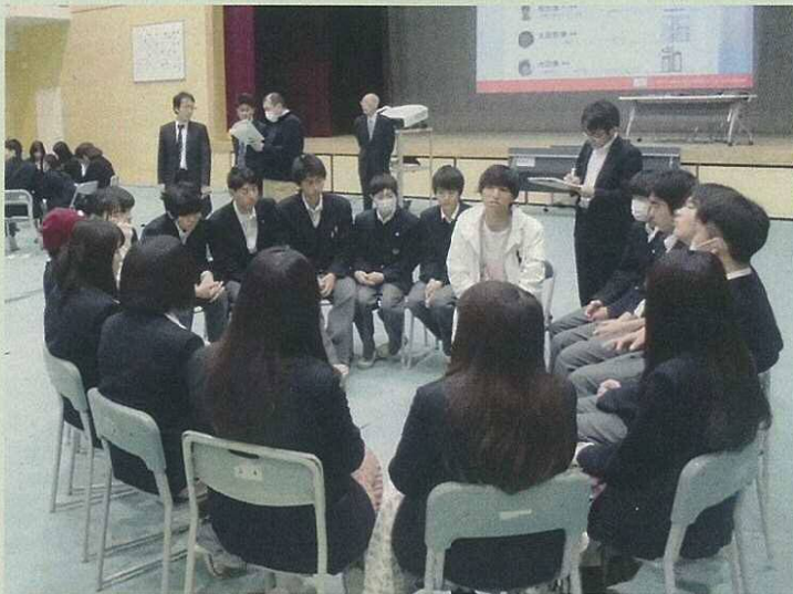
【南葛飾高等学校模擬選挙の様子】

それに伴い、若年層の政治意識の向上のために昨年から引き続き、今年の3・4月にも模擬選挙を区内高等学校2校で実施しました(南葛飾高等学校・葛飾商業高等学校)。また、2月には都立葛飾特別支援学校にて、選管職員が出前授業を行いました。他にも横断幕の掲出や、図書館での啓発事業、駅頭にてポケットティッシュの配布等啓発活動に力を入れてきました。