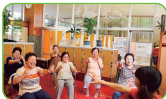
参加者同士、楽しく健康体操を行います。

会場には参加者の笑い声が絶えず、健康づくりだけでなく、他の参加者との交流を楽しみに来る方もたくさんいます。