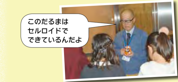
このだるまはセルロイドでできているんだよ