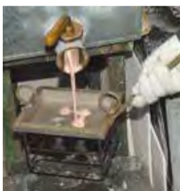
▲原料を注入している様子