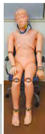
▲救助訓練用マネキンオビツボディ(タフネス)