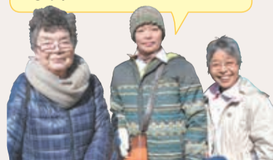
新小岩第二町会の皆さん