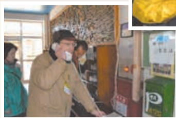
△災害時優先電話の設置