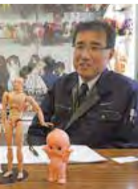
代表取締役社長) ーケティング部部長)

1966年)、区内には 行工場がたくさん なくなりました。 作業所で、原型製作 色・組み立て・完成 一つ手作業で心を込