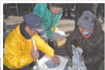
◀簡易トイレの組み立て

東日本大震災の教訓から、災害時に行政に頼るだけでなく、区民を中心に避難所の開設ができるよう、6つの自治町会、新小岩南地域まちづくり協議会などで構成する新小岩地区地域防災会議で、防災訓練が行われました。