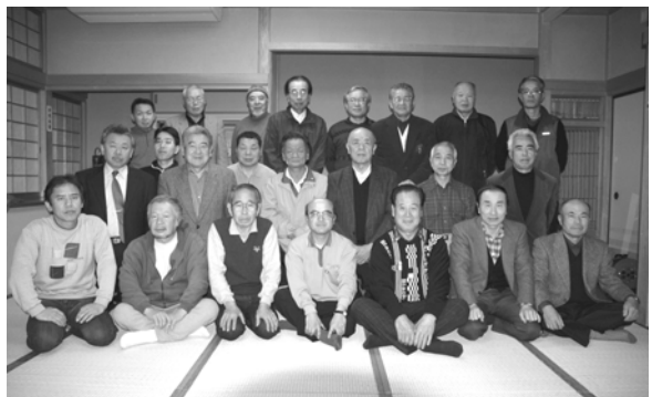
*この地図は、各自治町会の協力に基づき作成されたものです。

この防災マップは、自治町会の方々が実際にまちを歩いて作りました。 ・実際に歩いてみて防災の施設や防災に役立つものなど目撃がつかない多くの発見がありました。 ・まだまだ空間がある地域ですが、防災はどうしたらよいかを多くの人が考える場において防災マップの果たす役割は重要と重宝します。 ・今後の「まち歩き」の成果として転倒の恐れがある石像や一箇所に何台も置かれた自動販売機等のケースが把握できた。しかし、工場のドラム缶など中身まではわからないものの対策が必要だ。