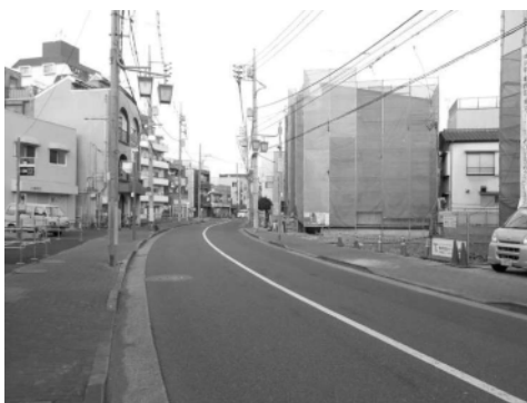
四つ木1-3-3街区の用地取得状況