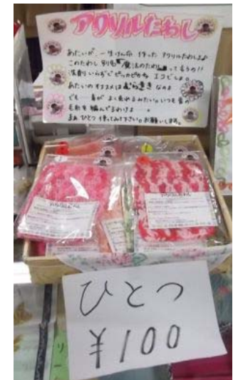
↑ 【人気商品】 洗剤のいらない 手作りアクリルたわし

シュレッター(細断)された紙を利用したカラフル植木鉢！ 大(70円)・中(30円)・小(10円)の3サイズあります。