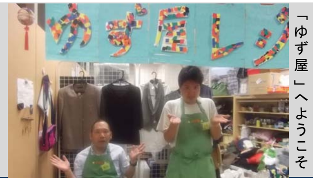
「ゆず屋」へようこそ

区民の皆様から無償で提供していただいた 新品同様の日用品のほか、トイレットペーパーなどの 区オリジナル再生品も販売しています。