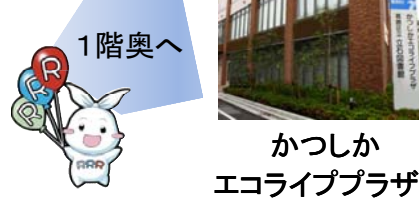
かつしか エコライフプラザ