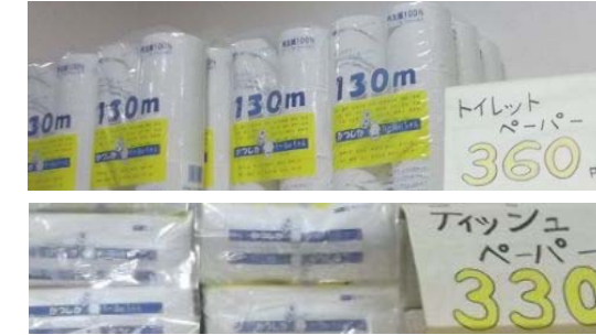
↑ 古紙100%の葛飾区オリジナル再生品 「かつしかリー(Ree)ちゃん」販売中。